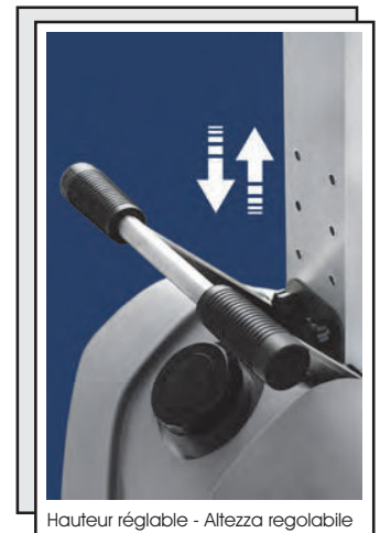
Hauteur réglable - Altezza regolabile

Moteur super-silencieux! Moins de 58 dB(A)